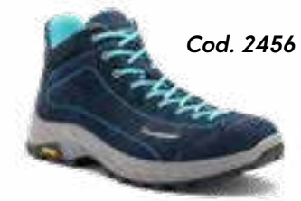
Cod. 2456 (W)